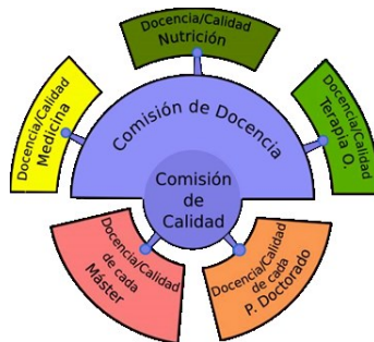
Figura 1. Estructura del Sistema de Garantía Interna de Calidad de la Facultad de Medicina

En el mismo se proporciona la descripción general del funcionamiento del Sistema de Garantía Interna de Calidad (SGIC) de la Facultad de Medicina se encuentra y su Reglamento de Funcionamiento vigente en el curso 2020-21 se resume en la Figura 1.